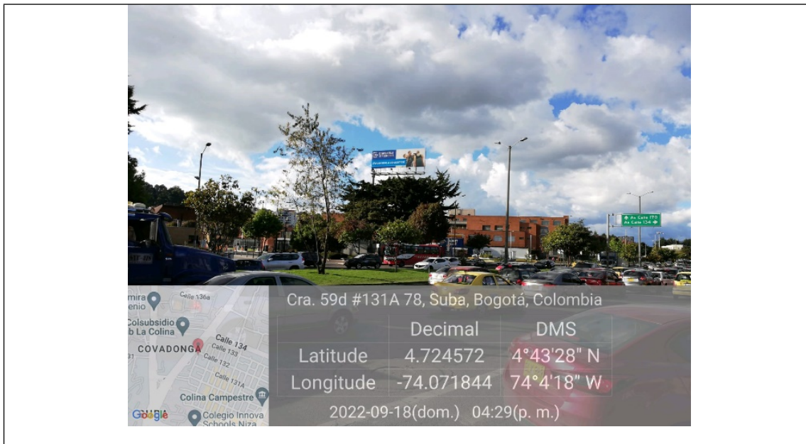
Foto 1. Vista panorámica del predio y de la valla ubicada en la Av. Carrera 72 No. 132 A 27 (dirección catastral) orientación Sur-Norte