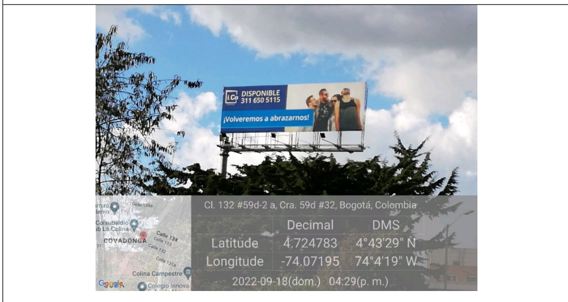
Foto 2. Vista del panel orientación Sur-Norte y de la estructura de la valla, en buenas condiciones y estable.